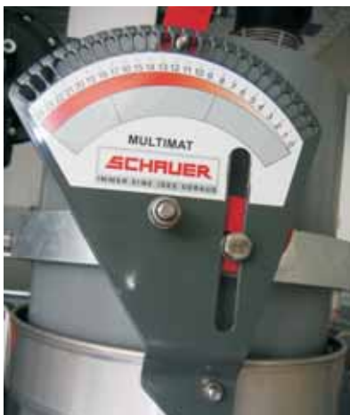
Rasterverstellung mit 24 Positionen für einfache Bedienung