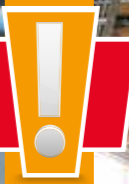
Strohmatic Air ASD